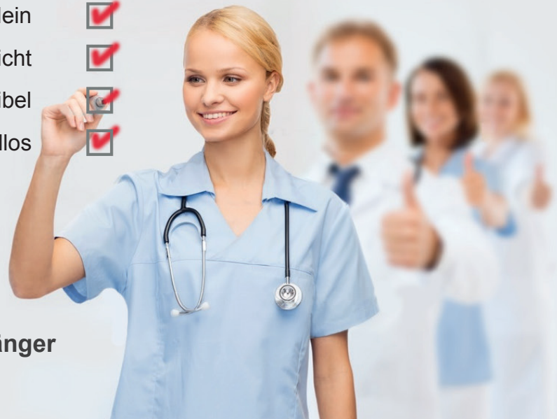
Der tragbare Rufempfänger mit Alarmfunktionen