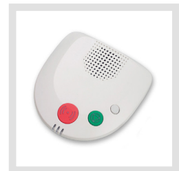
Gateway GW-a/b bzw. Gateway GW/GSM