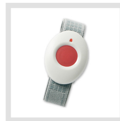
Funk-Druckknopf PNG-FD (optional)