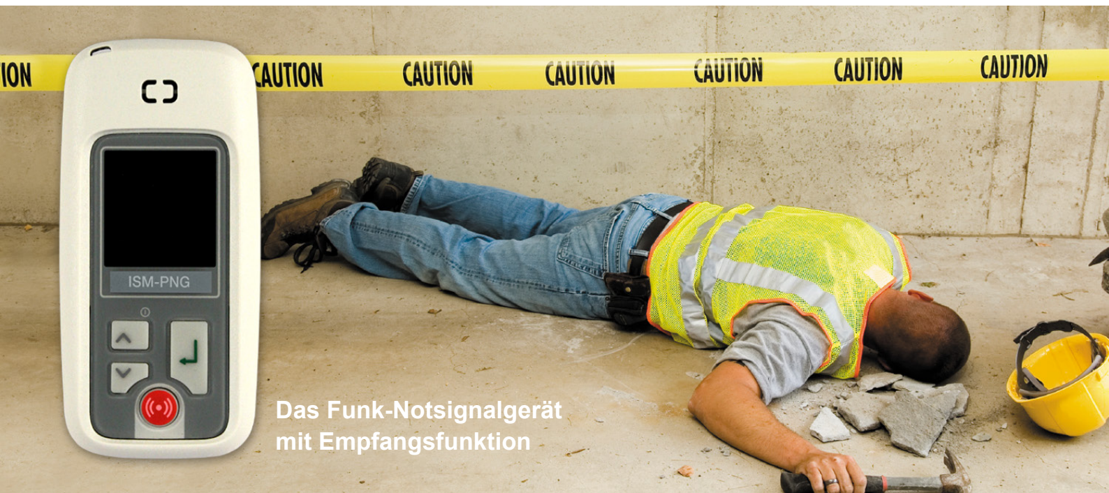
Das Funk-Notsignalgerät mit Empfangsfunktion

ISM 3000/PNA ist gebührenfrei, anmeldfrei und sofort einsetzbar. Das System nutzt speziell den von der EU für Personennotrufe reservierten und störungsfreien Frequenzbereich von 869 MHz.